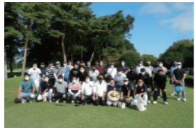
優勝 下妻市商工会青年部 準優勝 桜川市商工会青年部 第三位 古河市商工会青年部

令和3年10月14日に坂東市猿島カントリー倶楽部にて県西地区商工会青年部ゴルフ大会が開催されました。