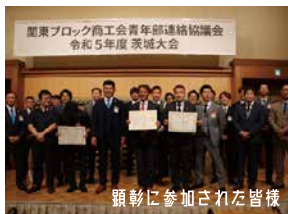
顕彰に参加された皆様