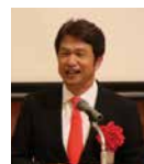
茨城県知事 大井川和彦氏